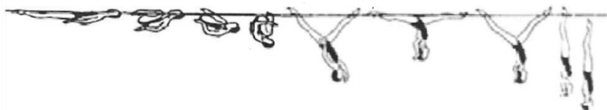
FIGURA II _ FLORETA (amb variant)

La figura es comença en posició de decúbit supí .