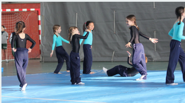
Tot preparant la participació d'artística a la Mar Bella

El cap de setmana va començar amb la dansa, celebrada al teatre de la Salle Bonanova: hi van assistir 388 participants de 21