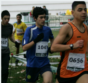
L'esport tornarà a donar exemple

EL CROS DE SANTS-MONTJUÏC DEL DIA 18 RECOLLIRÀ LES APORTACIONS DE TOT L'ESPORT ESCOLAR DE BARCELONA