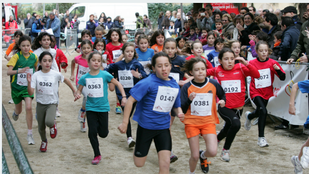
Sortida de les atletes del 2002. Màxima tensió per guanyar un bon lloc. (G. GOODWIN)

com ja és habitual, a les categories dels nens i nenes més petits. Pares, mares i avis van omplir moltes parts del recorregut per veure de ben a prop als