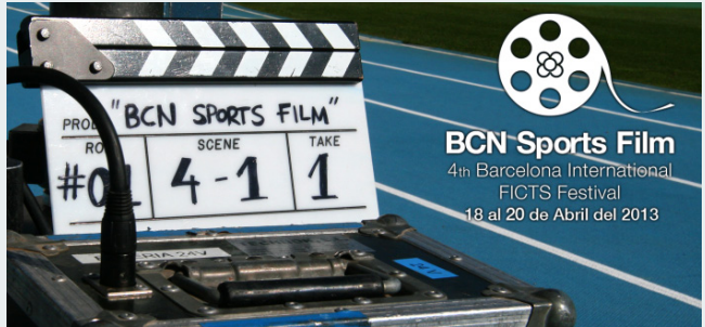
Cartell de la quarta edició del Festival

han reservat un a sessió especial per a nens i nenes, joves, de les escoles de la ciutat. El dijous 18 d'abril, en sessió de primera hora de la tarda, tots els centres educatius que estiguin interessats en assistir a aquesta sessió reservada, amb projecció a determinar però sobre la base de l'esport i l'educació, poden reservar la seva plaça per assistir al Museu Olímpic Joan Antoni