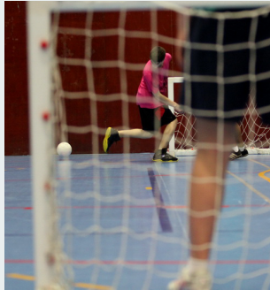
Les competicions 3x3 van tenir molt èxit