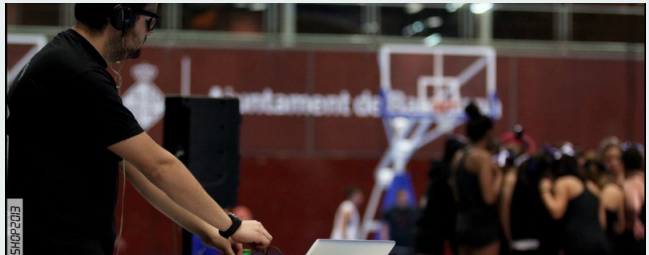
L'Escola Plàstic va estar també present amb els seus DJ's, animant l'activitat

LA PRIMERA EXPERIÈNCIA ENS HA MOTIVAT PER REPETIR ELS PROPERES DIES 11 I 25 DE MAIG I 15 I 22 DE JUNY