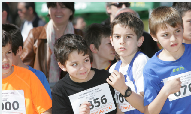
Preparats per la sortida de la cursa!!

El cros de Nou Barris, celebrat el passat 14 d'abril, no va decebre les expectatives generades de cada any. Uns 800 participants de diferents edats van oferir tot un espectacle esportiu i atlètic pel circuit dissenyat per a l'ocasió dins del Parc central de Nou Barris. Durant tot el matí el parc va estar ple de gom a gom, entre participants i espectadors. I com a nota destacada la presència de Jordi Bello, ex-sotscampió del món i campió d'Espanya dels 3.000