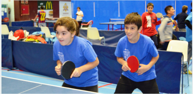
Pavellons com el del CEM La Mar Bella tornaran a acollir intenses competicions

reunions per posar idees en comú amb les entitats amb les quals treballa i donar a conèixer les novetats d'aquest curs.