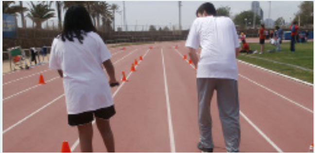
Les trobades d'esport sense barreres s'omplen de diversió i d'il·lusió

La solidaritat, ingredient de l'humanisme, és un dels valors fonamentals del CEEB. Per aquest motiu, El CEM La Mar Bella acollirà el dimecres, 11 de maig de 10.00 a 14.00 h., la setena trobada ludicoesportiva d'esports sense barreres. Comptarà amb centenars de