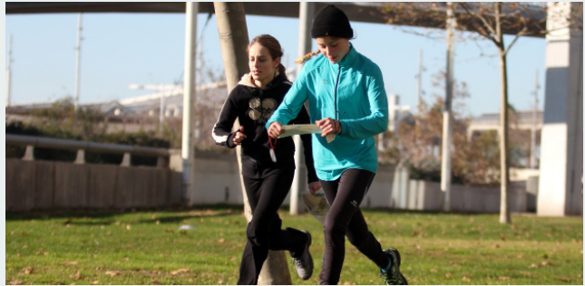
La capacitat de reconèixer l'entorn és més important que la velocitat

La cursa tindrà lloc al Parc de les Aigües, el dissabte 16 de gener, i s'espera la participació de 350 nens, nenes i joves aproximadament. L'horari de sortida dels esportistes serà de 10.00 a 12.30 h. La parada Alfons X de la Línia 4 (groga) i els autobusos H6, V21, 55, 114, 32, 39, 55 faciliten el desplaçament fins al punt de sortida, ubicat al costat de l'entrada principal del Parc. Conegut com un lloc de descans i lectura a l'estiu, el Parc de les Aigües està format per una estructura esglaonada amb terrasses independents separades per murs de pedra i camins. Tot i que la majoria de zones estan