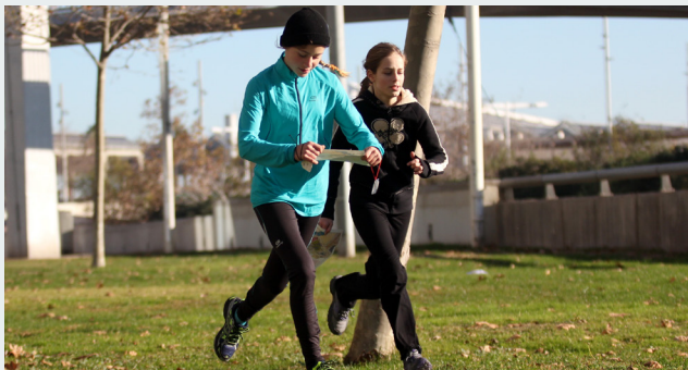
El Parc del Poblenou acomiadarà una bona temporada d'orientació

placetes, zones de vianants i circulació ocasional de vehicles de motor. No obstant això, cal extremar la precaució de la mateixa manera que en la resta de circuits d'orientació. Especialment, a l'hora de travessar un carril bici. Un cop finalitzada la cursa, s'entregaran guardons als primers classificats. Com ja és habitual, el CEEB obsequiarà a cadascun dels assistents amb productes saludables, gentilesa dels col·laboradors de la cursa.