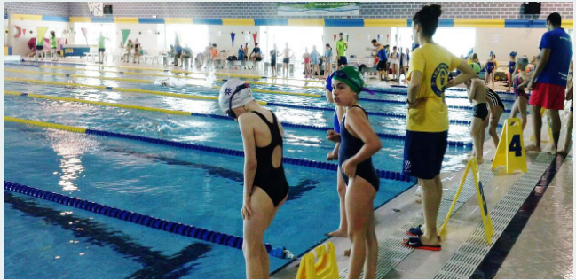
El Club Atlètic-Barceloneta és un espai idoni per a jornades de natació

desenvolupar les curses de les categories infantils, cadets i juvenils. Per altra banda, diumenge 22 al matí, es van cele-