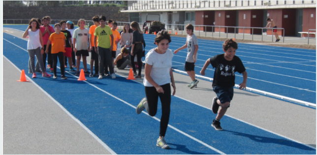
Per inscriure's al primer tast atlètic cal enviar un correu a promocio@elconsell.cat

per part de centenars d'escolars procedents de centres docents de Barcelona. Per inscriure's en aquesta activitat, cal enviar un correu a l'adreça promocio@