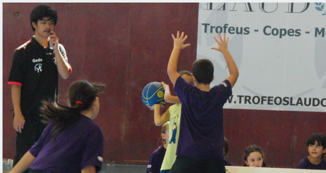
La jornada tornarà a comptar amb una figura essencial del CEEB: els tutors de joc

Es recomana tramitar la inscripció amb prou antelació, ja que el termini finalitzarà quan s'hagi inscrit el màxim d'equips permesos. La pàgina web per gestionar-ho és la següent: www.cistellasolidaria.org .