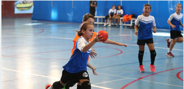
Cada temporada, aquesta fascinant disciplina d'equip segueix augmentant...

Seguidament, se celebrarà una sessió d'hanbdol en horari lectiu