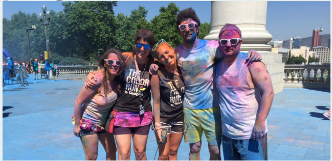
Els assistents van presentar-se amb roba còmode, ulleres de sol i disfresses

da després del gran èxit aconseguit l'any passat. La festa, organitzada per IMG, va comptar amb la col·laboració