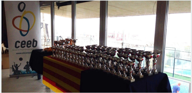
Els guanyadors de cada categoria van rebre una merescuda copa pel seu esforç.

tic Barceloneta. El Crol, la braça, l'esquena i la papallona van tornar a ser els estils utilitzats al llarg del campio-